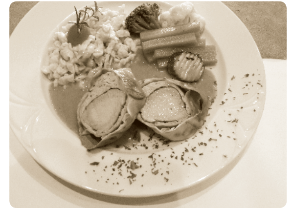
Schweinefilet, im Strudelteig gebacken, mit kräftigem Birnenbrandrahm, dazu hausgemachte Spätzle in Gemüsearrangement.