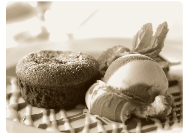
Süße Kreationen für den besonderen Abschluss.